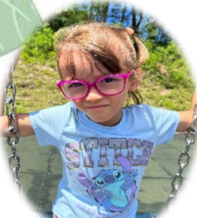
マクリア リリス ① トマト ② お友達と歌うこと