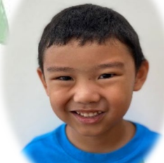
イラノ ジェイレン ① フライドライス ② 外遊び