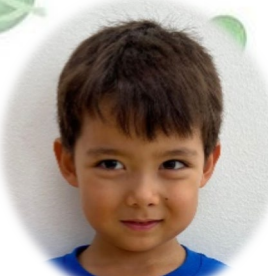
ウェストフォール かいあす ① コーンスープ ② 砂遊び