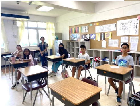
2024年度 グアム日本人学校補習授業校 中学部入学式