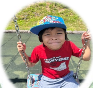
しばた ゆうしん ① からあげ ② あいさつのダンス