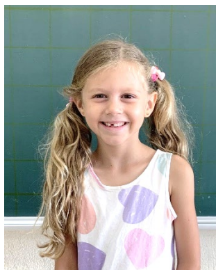
メディナ ザラ 1. おにぎり、天ぷらうどん 2. 算数と国語と休み時間とお弁当