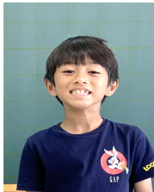
アデルバイゼイン