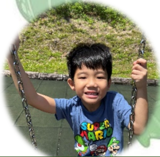
イージャン たいか ① からあげ ② 外遊び