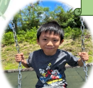
かたくら かず ① からあげ ② 図工 (お友達と何かを作ること)