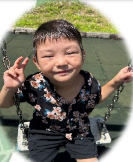
ボーハ リゅうま ① ソーセージ ② お友達と歌を歌うこと