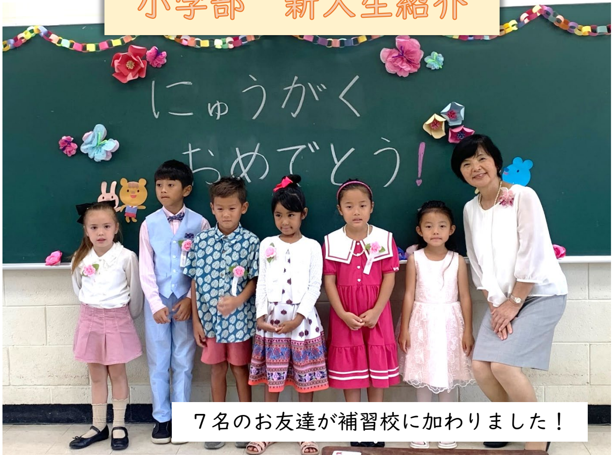
7名のお友達が補習校に加わりました！